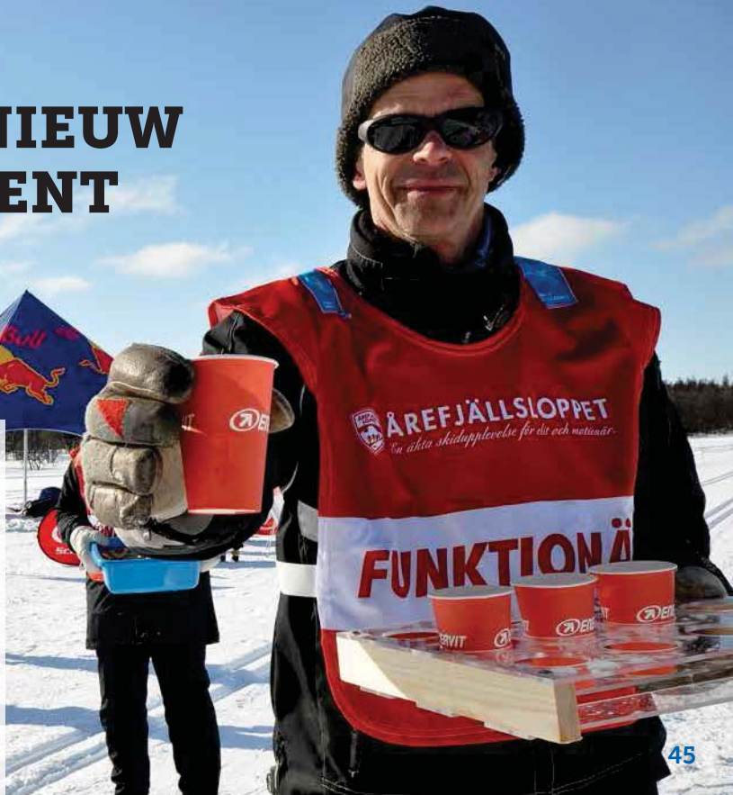
Årefjällsloppet: goed verzorgd verder op weg