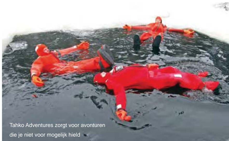
Tahko Adventures zorgt voor avonturen die je niet voor mogelijk hield