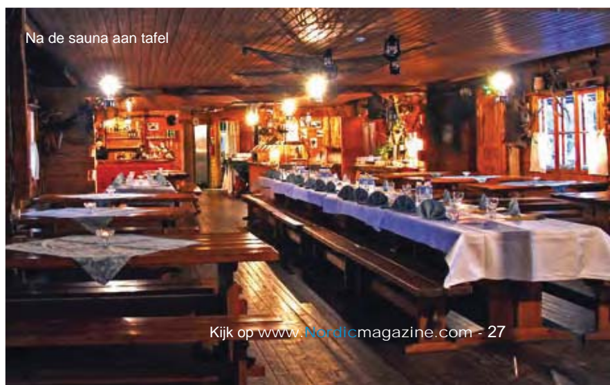
Na de sauna aan tafel