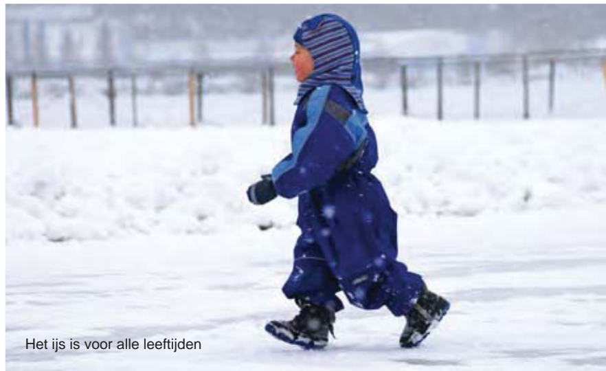
Het ijs is voor alle leeftijden