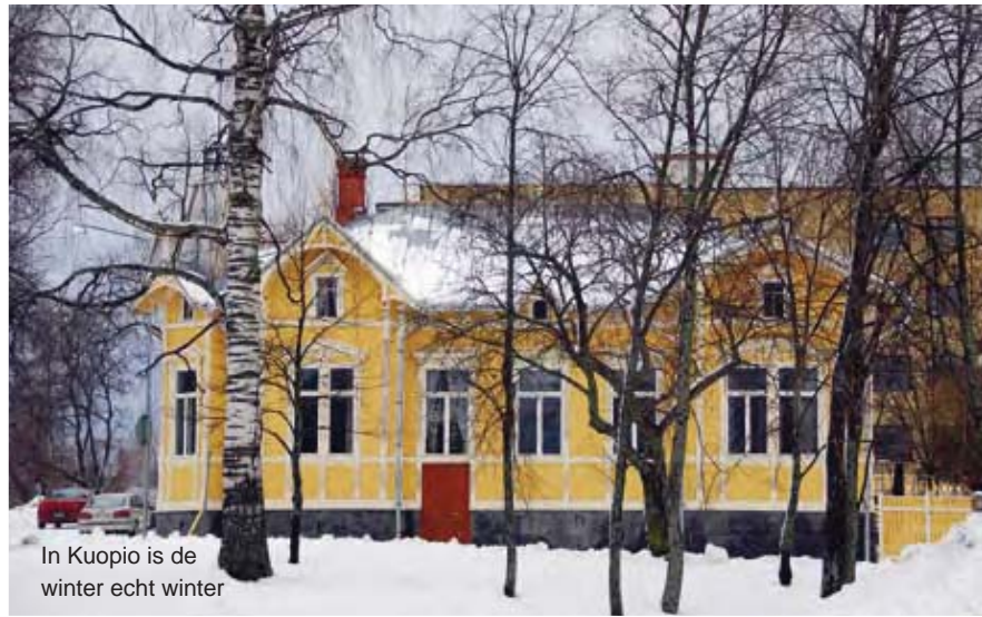
In Kuopio is de winter echt winter

Als de buitentemperatuur daalt, wordt de sauna warmer